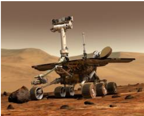
Bilde: Opportunity. NASA

Det ble fort klart at det ikke bor små grønne menn på Mars, men letingen på spor etter tidligere liv, og kanskje mikrobisk liv, fortsetter. Forskerne har bekreftet at det en gang må ha vært vann og elver på Mars, og det antas at det kanskje finnes vann et stykke under overflaten. Det har også blitt bekreftet at det finnes is ved polområdene. Dette øker spenningen og troen på at det kan være spor etter organismer der hvor det finnes vann.